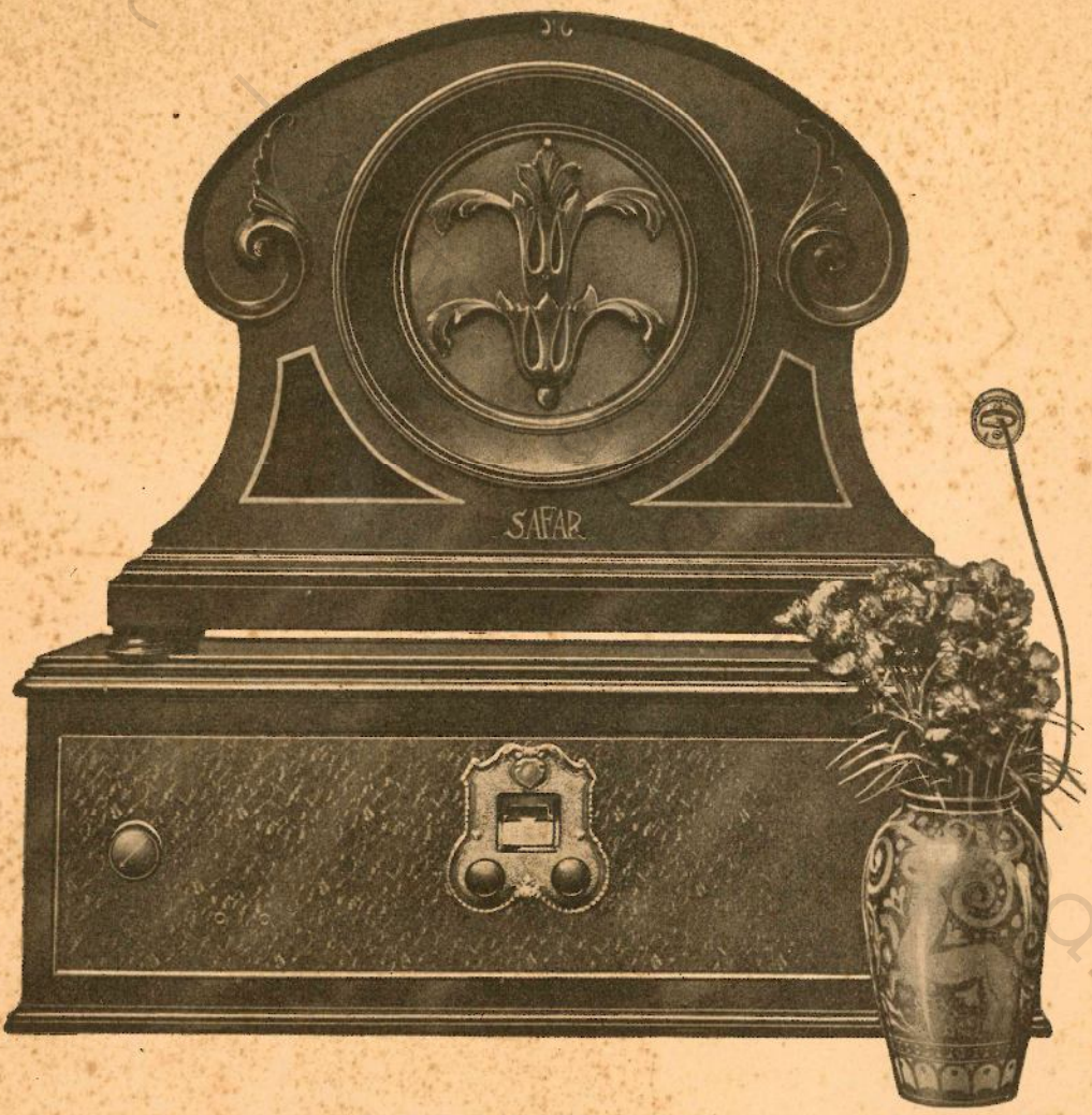
RADIOLA MORGAN 127.